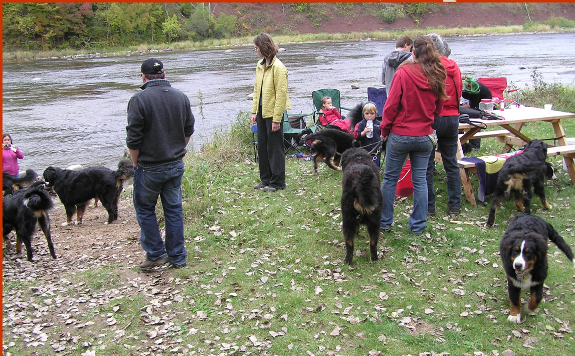
À Bécancour, de l'espace, des familles, des boubous en liberté... et aucun problème !