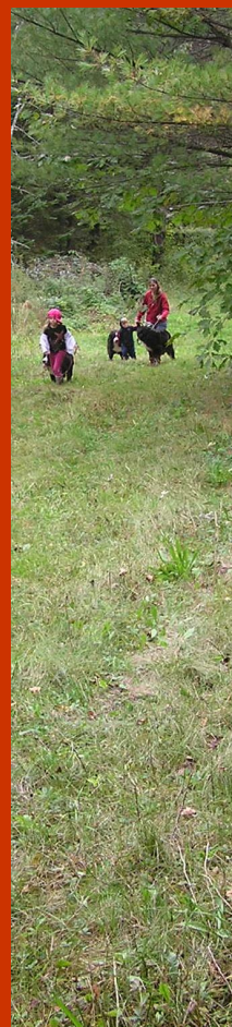
..... on arrive !