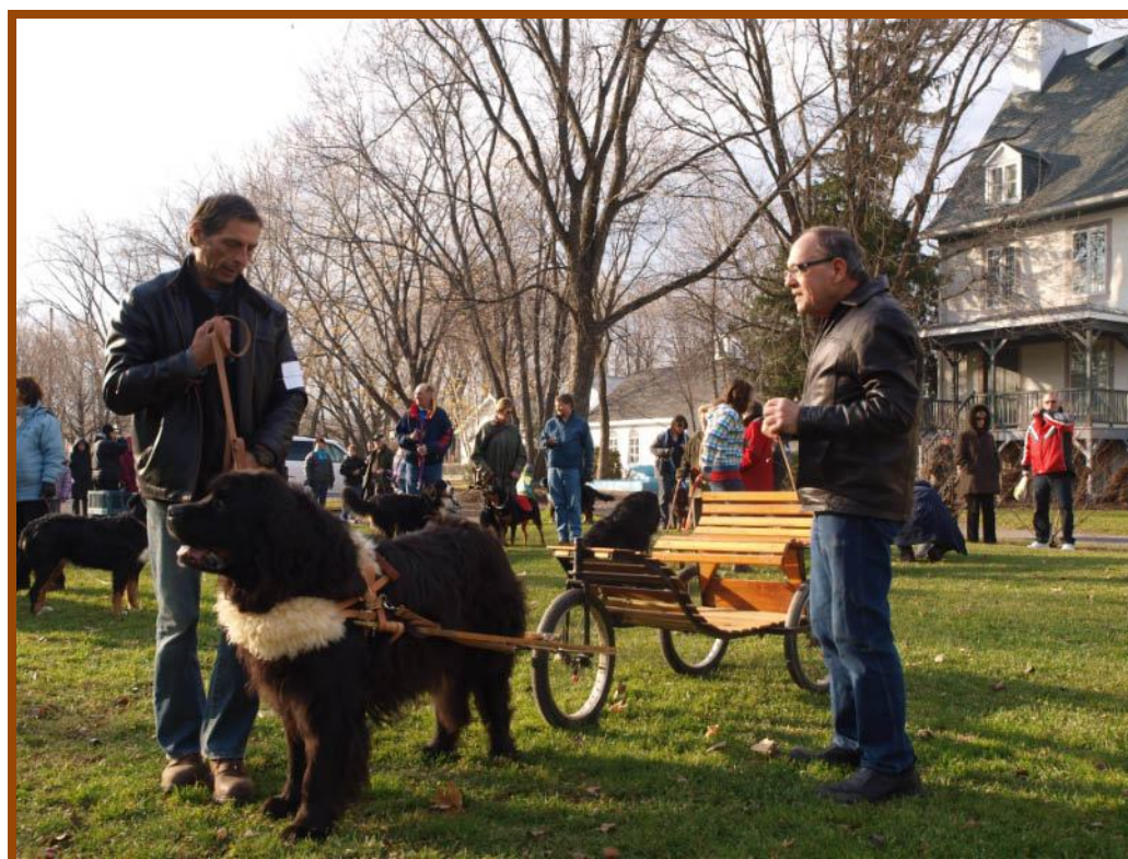
Chouette équipement !!!! En préparation pour le concours homologué.