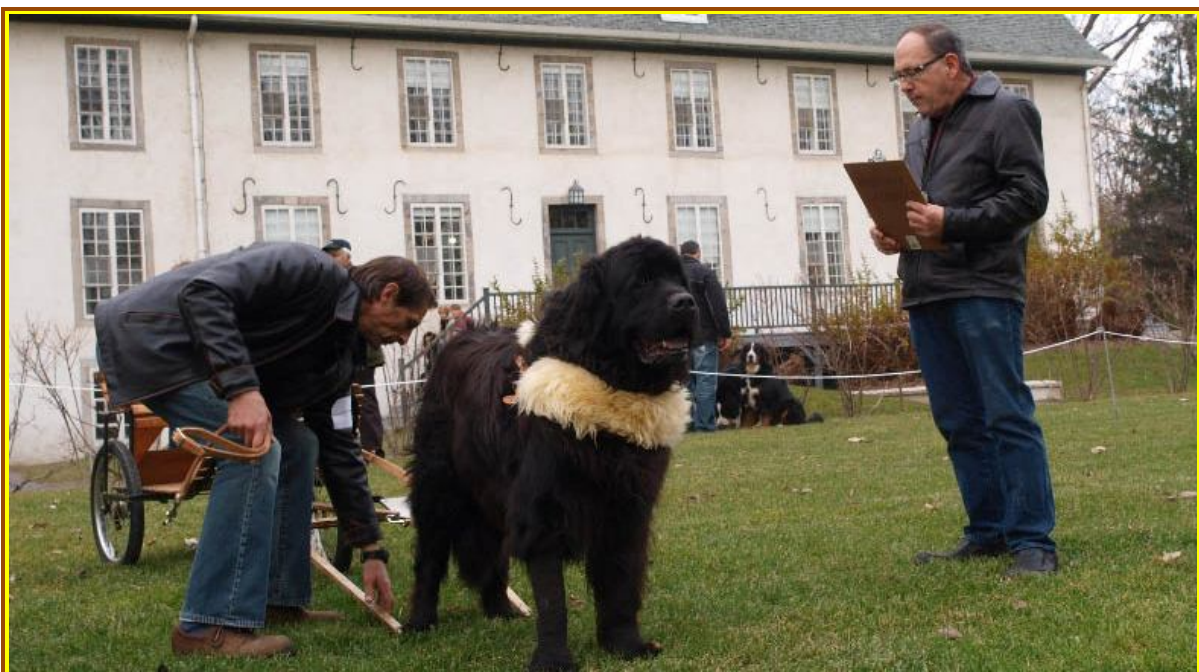
Sous l'œil attentif du juge